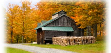
Vermont Department of Tourism & Marketing