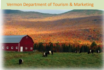
Vermont Department of Tourism & Marketing