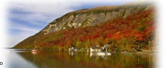
Vermont Department of Tourism & Marketing